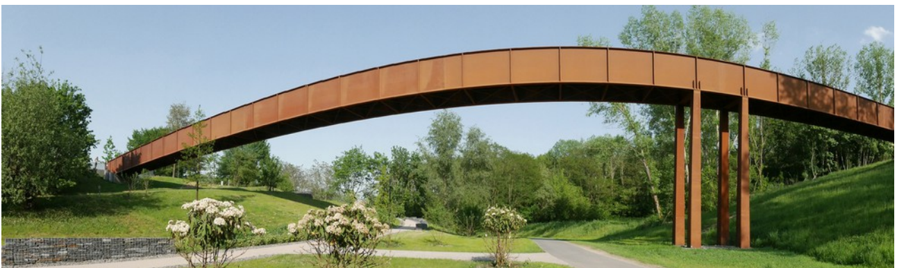
Tälchenbrücke in den Gärten der Welt Berlin, um die herum sich 6 Hörbäume befinden, in denen sich Lautsprecher verstecken.

In den Workshops geht es zunächst um die grundlegende Hörerfahrung im offenen Raum (die Tälchenbrücke im Park), die die Installation bietet. Dann werden je nach Alter verschiedene Programme aufgerufen, wobei der/die Gruppenleiter/in von der App durch den Workshop geführt wird, so dass Schulklassen mit Lehrer/in die Workshops auch selbständig durchführen können: